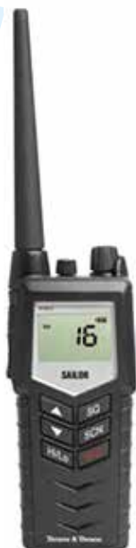
Eksempel på en bærbar VHF